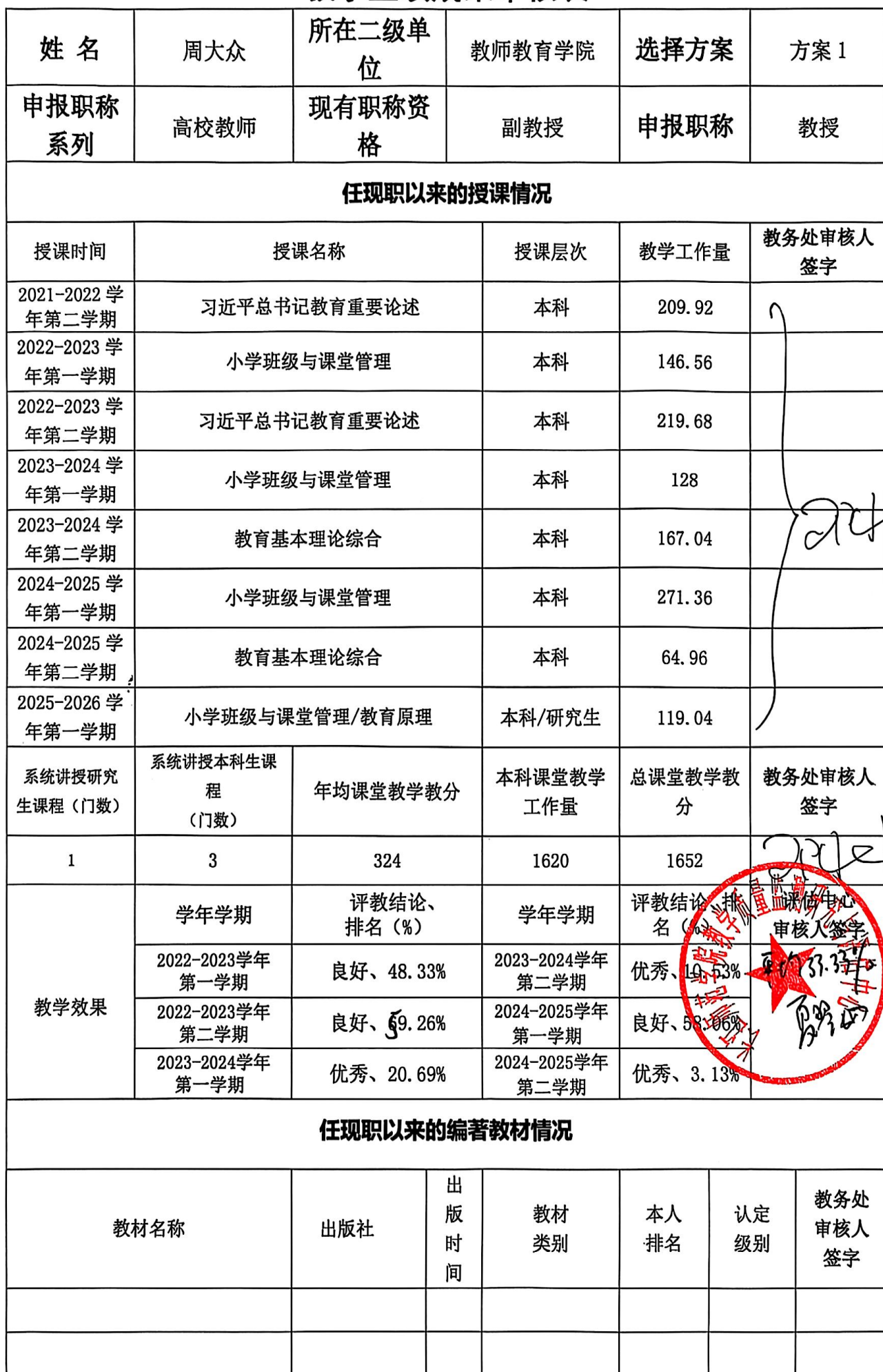
教学业绩成果审核表